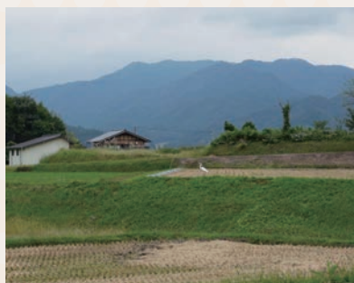
↑ きりんの建物玄関から宮川方面を 眺めるしらすぎらしき白い鳥は いつもいるそう

古川町にあるきりんの施設は、 森林公園のすぐ隣、ゆるやかな 斜面に建っています。 斜面にそって広がる田園風景と 四季折々に色づく木々、さまざま な鳥や動物たち...街中からは 少し離れていますが、日々穏や かに変わる景色を楽しんで欲し くてこの場所を選びました。