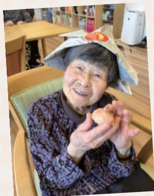
↑ 天ぷら饅頭を持って はい、チーズ!

ここには「デイサービスきりん ひだ」と「グループホームきりん 飛騨」、「小規模多機能ホームき りん心と」の3施設があります。 それぞれ役割が異なるのは、地 域の皆様一人ひとりの要望に少 しでも応えられるようにするた め。特に小規模多機能は飛騨市 で唯一、ここだけの施設です。 (令和5年7月時点)